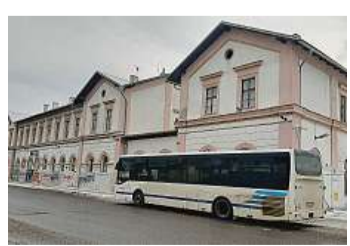
Staré a nové Hlavní kladenské nádraží je v provozu od 5. listopadu 1855. Architektonický návrh je jeho možnou budoucí podobou.

„Průzkum bylo možné provést až po vyklizení budovy a jejím uzavření pro veřejnost. Kopanými sondami byly zjištěny odlišné základové poměry budovy a nastoupaná podzemní voda,“ uvedla Eberl Friebová. To podle ní znamená významně